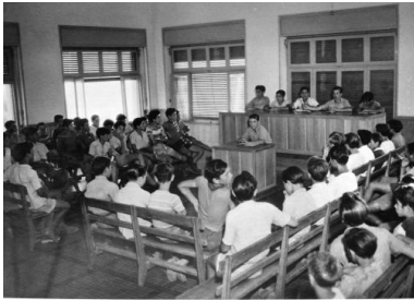
A Town-Meeting in the Assembly of the Marine Village. Una seduta dell'Assemblea del "Villaggio Marino".

« Ce sont eux qui manient pelles et pioches, marteaux et truelles pour cultiver les terres et bâtir leurs villages ; ce sont eux qui gèrent et composent leurs propres gouvernements (qu'ils s'appellent "conseil fédéraux", "conseils municipaux"... ) mais aussi leurs tribunaux, leurs forces de police, leurs coopératives, journaux et parfois même leur monnaie intérieure. »