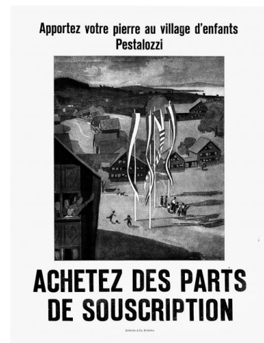
Prospectus d'appel à dons pour le village Pestalozzi de Trogen.

Le village d'enfants Pestalozzi – projet à la fois humanitaire, pédagogique et architectural – est rapidement promu « en modèle international d'éducation » tout en cherchant à réhabiliter l'image de la Suisse « écornée par l'ambiguïté de sa neutralité politique ».