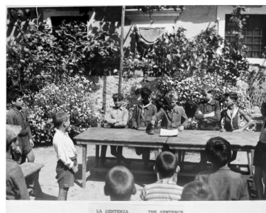
Tribunal d'enfants de la Repubblica dei ragazzi di Civitavecchia vers 1948.

d'un écusson épinglé sur la poitrine. En outre, un « tribunal des enfants » est mis en place pour l'administration de la justice.