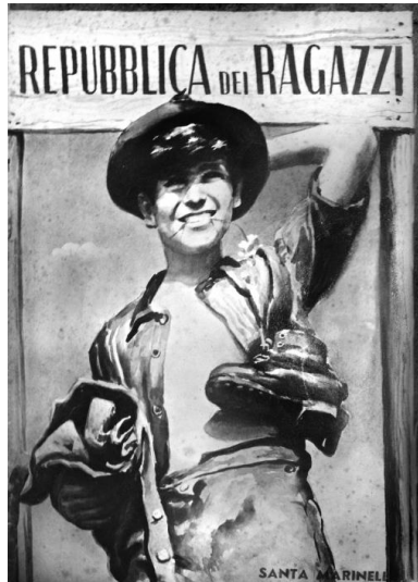
Brochure présentant la Repubblica dei ragazzi de Civitavecchia, 1949.

Le livre explore cette réalité, éphémère et largement oubliée, en proposant alors les monographies roboratives et successives de plusieurs de ces petites républiques, dont les auteurs ont dépouillé les archives.